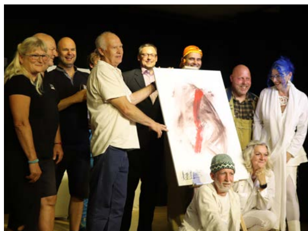
Obraz vytvořený při hře vydražen za 80 EUR a výdělek věnovali hostitelskému spolku.

Noc opět proběhla ve znamení rock'n'rollu. V neděli nás čekalo dojemné loučení a cesta domů, s krátkou zastávkou u Balatonu, kde jsme si připomněli scénu z filmu *Pelíšky*. Tento zájezd se jednoduše až neuvěřitelně povedl.