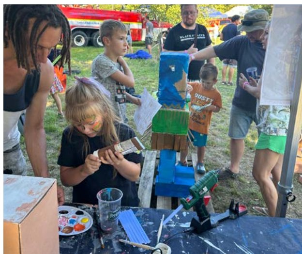
Výroba svatého Floriána

Na výzvu hlásnotřebaňských dobrovolných hasičů jsme se podíleli na jubilejním HASOFESTu. Vytvořili jsme stanoviště na stezce sv. Floriána, kde jsme s dětmi sestavili z krabic parádní lego postavičku patrona hasičů v životní velikosti. Děti se pod vedením našich kreativců opravdu vyznamenaly. Jak se jim postavička povedla, můžete posoudit sami.