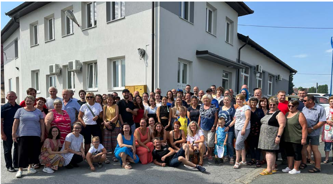
Dolanští, Formani a Hlásná Třebaň - loučení