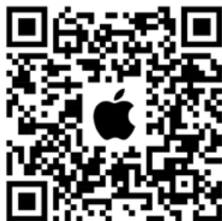
Aplikace Apple Podcasts

Budeme rádi za zpětnou vazbu a uvítáme také vaše dotazy a náměty na témata pro další díly.