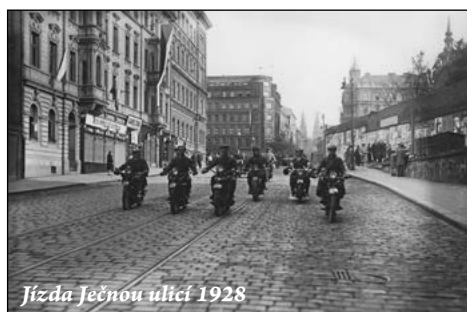
Jízda Ječnou ulicí 1928

Jak je celé řadě obyvatel naší obce známo, je Hlásná Třebaň od roku 2011 oficiálním sídlem Harley-Davidson Clubu Praha. Dovoluji mi, abych v roce oslav nejen stoletého