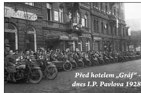
Před hotelem „Gráf“ - dnes I.P. Pavlova 1928

Harley-Davidson Club Praha je nejstarším existujícím Harley-Davidson klubem na zeměkouli. Myšlenka na jeho založení vznikla v roce 1927 na svatbě slavného motocyklového závodníka Bohumila Turka, tehdejšího ředitele firmy Tesárek, dovážející tehdy do ČSR mo-