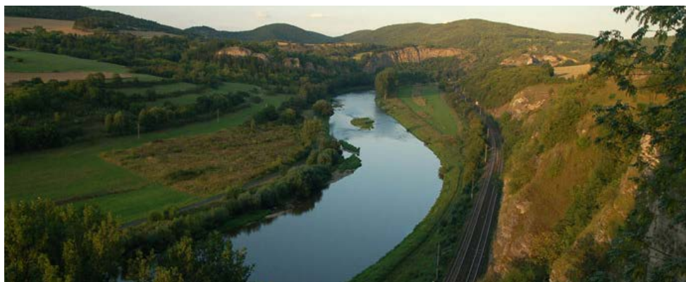
Berounka – kaňon

stupem Keltů a budováním výšinných sídel – hradišť. Nejbližší, na místě zvaném Holý vrch, bylo nad nedalekou obcí Bukovec. Řeka Úslava na horním toku nad Žinkovy, označovaná též jako Bradlava, pramení na jihovýchodním úpatí kopce Drkolná (729 m n. m.), jihozápadně od obce Číhaň, v nadmořské výšce 637,2 m. Nejprve teče k východu, kde u obce Hnačov napájí velký Hnačovský rybník (druhý největší rybník v západních Čechách - byl založen byl roku 1613 mnichy z kláštera v Nepomuku, měl původně rozlohu přes 100 ha). Odtud se obrací na sever, protéká městem Plánice. Pod Žinkovy se opět obrací na východ, protéká v blízkosti zámku Zelená Hora, stojícího na stejnojmenném kopci, který je u města Nepomuk. Pod obcí Vrčeň se prudce obrací na severozápad, protéká městy Blovice a Starý Plzenec. Mezi těmito městy na říčním kilometru 26,1, v obci Nezvěstice, ji sytí největší přítok, říčka Bradava, která přitéká z jihovýchodu od Spáleného Poříčí. Severozápadní směr si Úslava udržuje až ke svému ústí do Berounky v Plzni.