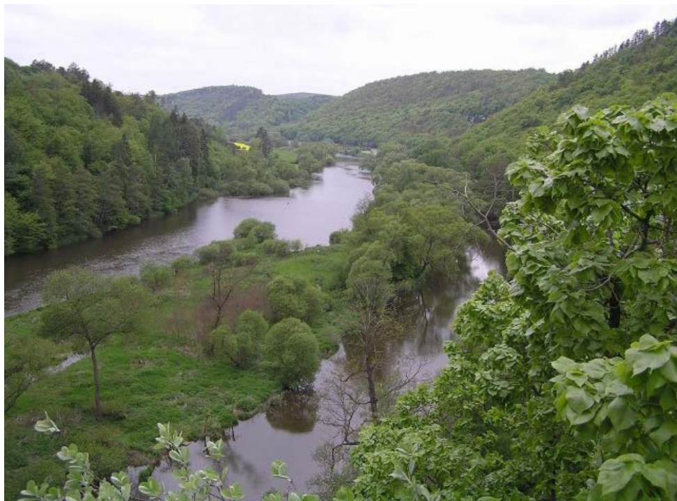
Ostrov na Berounce pod Hradištěm

Úslava je na horním toku nad Žinkovy označovaná též jako Bradlava, pramení na jihovýchodním úpatí kopce Drkolná (729 m n. m.), jihozápadně od obce Čihaň, v nadmořské výšce 637,2 m. Nejprve teče k východu, kde u obce Hnačov napájí velký Hnačovský rybník (druhý největší rybník v západních Čechách - byl založen roku 1613 mnichy z kláštera v Nepomuku původně měl rozlohu přes 100 ha). Odtud se obrací na sever, protéká městem Plánice. Pod Žinkovy se opět obrací na východ, protéká v blízkosti zámku Zelená Hora, stojícího na stejnojmenném kopci, u města Nepomuk. Pod obcí Vrčeň se prudce obra-