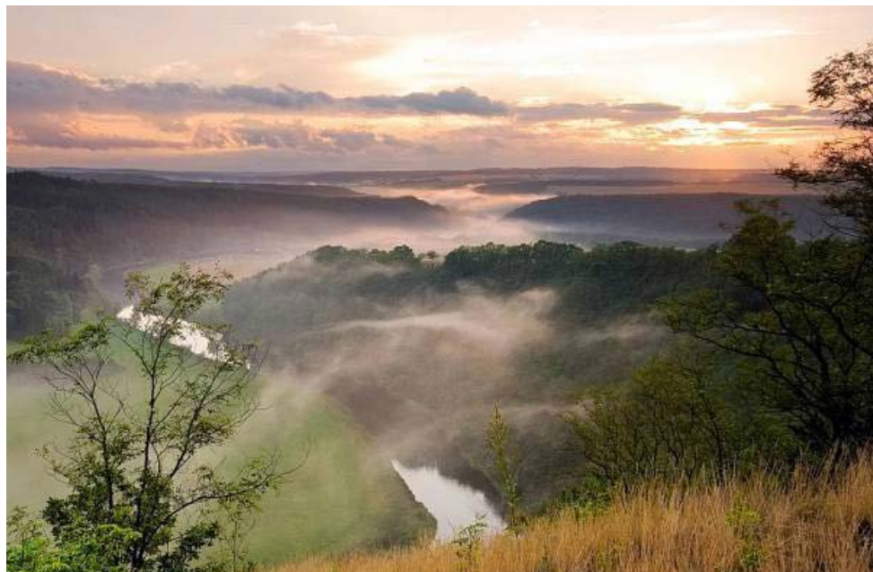
Horní Berounka - park

Na konci 17. století se začal užívat název Berounka pro dolní tok (za městem Berounem), v 18. století používali někteří autoři název Berounky i pro střední tok od Plzně. Za počátek Berounky začal být postupně považován soutok Mže a Rakovnického potoka, později se začátek Berounky posunul na soutok se Střelou a ještě později na soutok s Úslavou. Dnes začíná Berounka soutokem Mže s Radbuzou v centru Plzně.