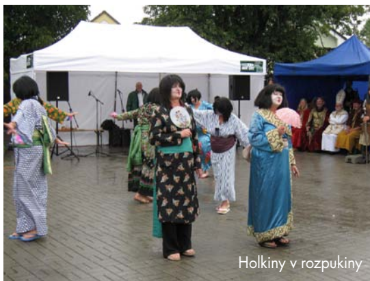
Holky v rozpukiny

diváků, ale brzy se zaplnily všechny lavičky postavené pro diváky pod stanem. Holky v rozpuku svojí slavnostní fanfárou přivítaly rychtáře a rychtárku a program začal. Orientální tanečnice předvedly vskutku nádherný tanec, skupina historického šermu své umění. Třehusk zpříjemňoval atmosféru hezkými a známými písničkami. Ze země vycházejícího slunce přijela vzácná delegace „Holky v rozpukiny“ a předvedla velmi zajímavý japonský tanec Šikmíno.