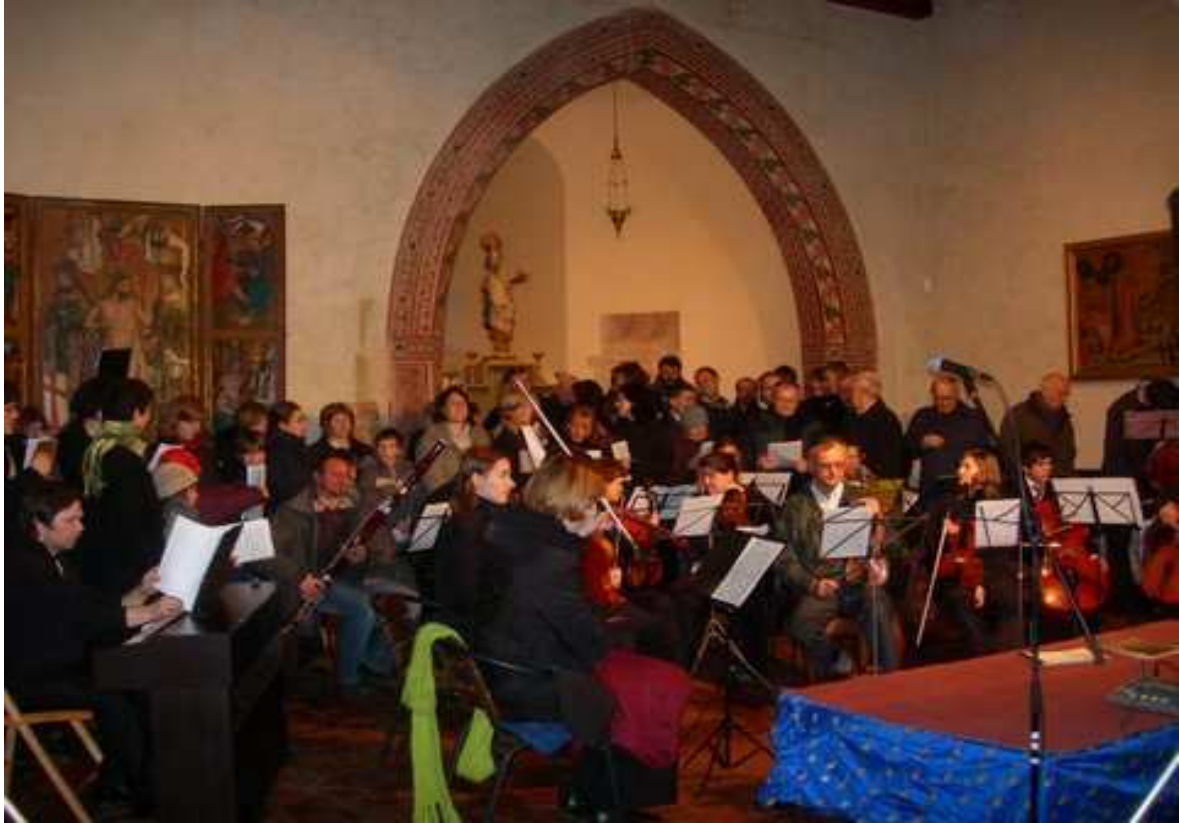
Vánoční mše „Hej mistře“